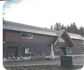
MYOKO BASE CAMP