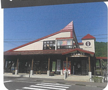
妙高高原観光案内所