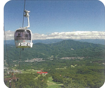
妙高高原スカイケーブル乗り場