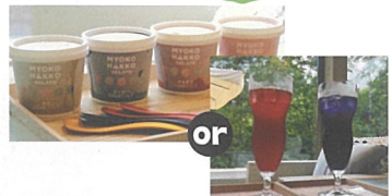
\ NAGOMI CAFEにて/ 妙高発酵ジェラート or ワンドリンク