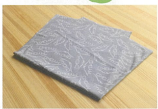
限定ネックウォーマー