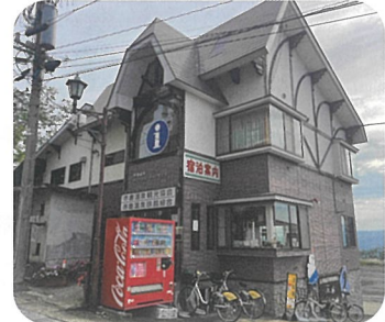
赤倉インフォメーションセンター