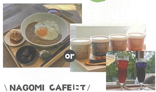
\ NAGOMI CAFEにて/ ランチ1点 or 妙高発酵ジェラート + ワンドリンク